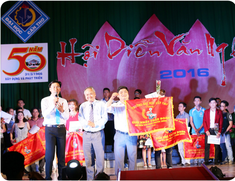
Khoa Công nghệ Thông tin và Truyền thông đạt Giải Nhất toàn đoàn.

toàn đoàn đã thuộc về Bộ môn Giáo dục Thể chất gồm 14 giải Nhất, 12 giải Nhì, 15 giải Ba; hạng Nhì thuộc về Khoa Công nghệ với 07 giải Nhất, 09 giải Nhì, 02 giải Ba; và với thành tích 07 giải Nhất, 03 giải Nhì, 03 giải Ba, Khoa Luật đã đạt hạng Ba toàn đoàn.