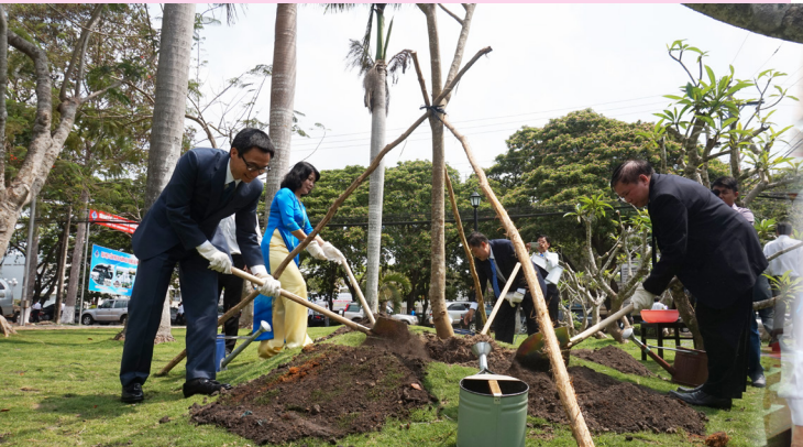
Phó Thủ tướng Vũ Đức Đam và các đại biểu trồng cây lưu niệm và tham quan Phòng Truyền thống của Trường.

Trong suốt chặng đường phát triển, dù có những thăng trầm nhưng bằng niềm tin mãnh liệt và sự gắn bó thiết tha với ngôi trường, với vùng đất nơi đây, toàn thể công chức, viên chức và sinh viên Trường ĐHCT cam kết và phấn đấu liên tục để ngày càng hoàn thiện và phát triển toàn diện để Trường ĐHCT trở thành trường đại học đẳng cấp khu vực và quốc tế trong tương lai gần, phục vụ tốt nhất nhu cầu của xã hội.