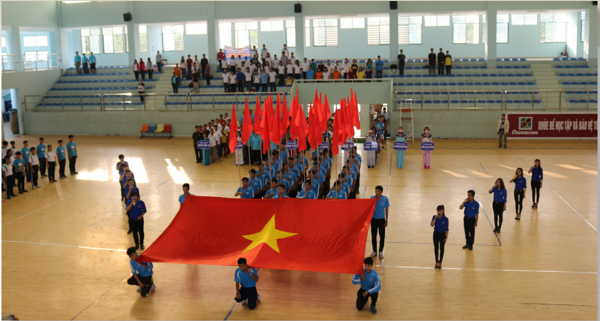
Toàn cảnh Lễ Khai mạc Hội thao.

N hằm lập thành tích chào mừng kỷ niệm 85 năm ngày thành lập Đoàn Thanh niên Cộng sản Hồ Chí Minh (26/3/1931-26/3/2016), 70 năm ngày thể thao Việt Nam 27/3, và kỷ niệm 50 năm ngày thành lập Trường Đại học Cần Thơ (ĐHCT) (31/3/1966-31/3/2016), Công đoàn Trường ĐHTC đã đăng cai tổ chức Hội thao liên kết Công đoàn các trường đại học và Quân khu 9 vào ngày 27/3/2016.