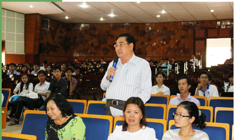
Đại biểu chia sẻ kinh nghiệm và đóng góp ý kiến.

Sau thời gian làm việc tích cực, Hội nghị đã nhận được nhiều ý kiến và chia sẻ kinh nghiệm của các sở, ban, ngành địa phương, các viện, trường, doanh nghiệp trong vùng đóng góp cho hoạt động KHCN của Trường ngày càng tốt hơn; đề xuất những hướng nghiên cứu mới cho ra những sản phẩm phục vụ sản xuất và đời sống; và tăng cường mối quan hệ giữa các đơn vị để công tác NCKH và CGCN luôn kịp thời và thành công. Bên cạnh đó, các đại biểu cũng bày tỏ niềm vui mừng và tin tưởng Trường ĐHCT sẽ đạt được kết quả tốt đẹp trong thực hiện Dự án Nâng cấp Trường và mong muốn rằng sự thành công của Dự án sẽ khẳng định hơn nữa vị trí trọng tâm của Trường trong thúc đẩy phát triển kinh tế-xã hội của vùng ĐBSCL nói riêng và của cả nước nói chung.