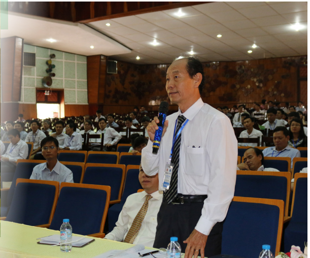
Báo cáo tham luận và đóng góp ý kiến tại Hội thảo.

thảo lần thứ 48 với chủ đề “Các trường đại học kỹ thuật với sự phát triển bền vững Tây Nam Bộ”. Ngoài việc tăng cường sự gắn kết giữa các thành viên trong CLB, Hội thảo còn nhằm mục đích xây dựng và phát triển sự hợp tác của CLB Khoa học-Công nghệ các trường đại học kỹ thuật với các tỉnh, thành vùng ĐBSCL, với mong muốn đóng góp cho sự phát triển kinh tế-xã hội bền vững Tây Nam Bộ.