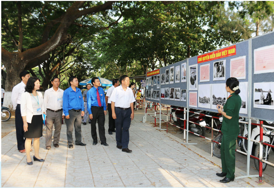
Đại biểu tham quan triển lãm của Bảo tàng Quân khu 9 về Đảng Cộng sản Việt Nam, Chủ tịch Hồ Chí Minh, Bác Hồ với học sinh sinh viên, Chủ quyền biển đảo Việt Nam.

Hoạt động 1: Phát động Hội thi Olympic các môn Khoa học Chính trị và Tư tưởng Hồ Chí Minh trong sinh viên Trường năm 2016. Hội thi diễn ra dưới hai hình thức (cá nhân và tập thể). Hình thức thi cá nhân: Dự kiến khoảng 15.000 sinh viên dự thi trực tuyến theo địa chỉ: http://olympickhct.ctu.edu.vn/ đến hết ngày 08/5/2016. Sau đó, 200 thí sinh có điểm số cao nhất được chọn thi Chung kết vào ngày 14/5/2016. Hình thức thi tập thể: 16 đội bốc thăm, chia bảng thi đấu. Vòng loại diễn ra vào ngày 15/5/2016, sau đó chọn ra 4 đội vào thi Chung kết tối 19/5/2016.