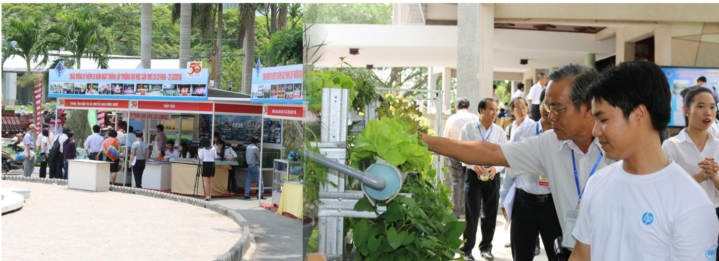
Các đại biểu tham quan khu triển lãm thành tựu đào tạo và nghiên cứu khoa học 50 năm của Trường.

Hội thảo là dịp để CLB và địa phương gặp gỡ, chia sẻ, trao đổi thông tin và hợp tác nhằm giới thiệu các công nghệ có thể chuyển giao, các vấn đề cần hợp tác nghiên cứu khoa học để cùng nhau tháo gỡ những vấn đề còn vướng mắc, đóng góp cho sự phát triển bền vững Tây Nam Bộ.