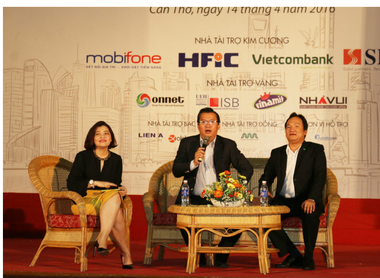
Giao lưu giữa các diễn giả-doanh nhân và sinh viên.

Năm 2016, Startup Wheel được tổ chức lần thứ 4 tại bốn khu vực miền Bắc, miền Trung, miền Đông Nam Bộ và miền Tây Nam Bộ, tập trung ở bốn thành phố lớn: Hà Nội, Đà Nẵng, thành phố Hồ Chí Minh và Cần Thơ. Ngày 14/4/2016, Chương trình phát động Cuộc thi Ý tưởng khởi nghiệp Startup Wheel 2016 khu