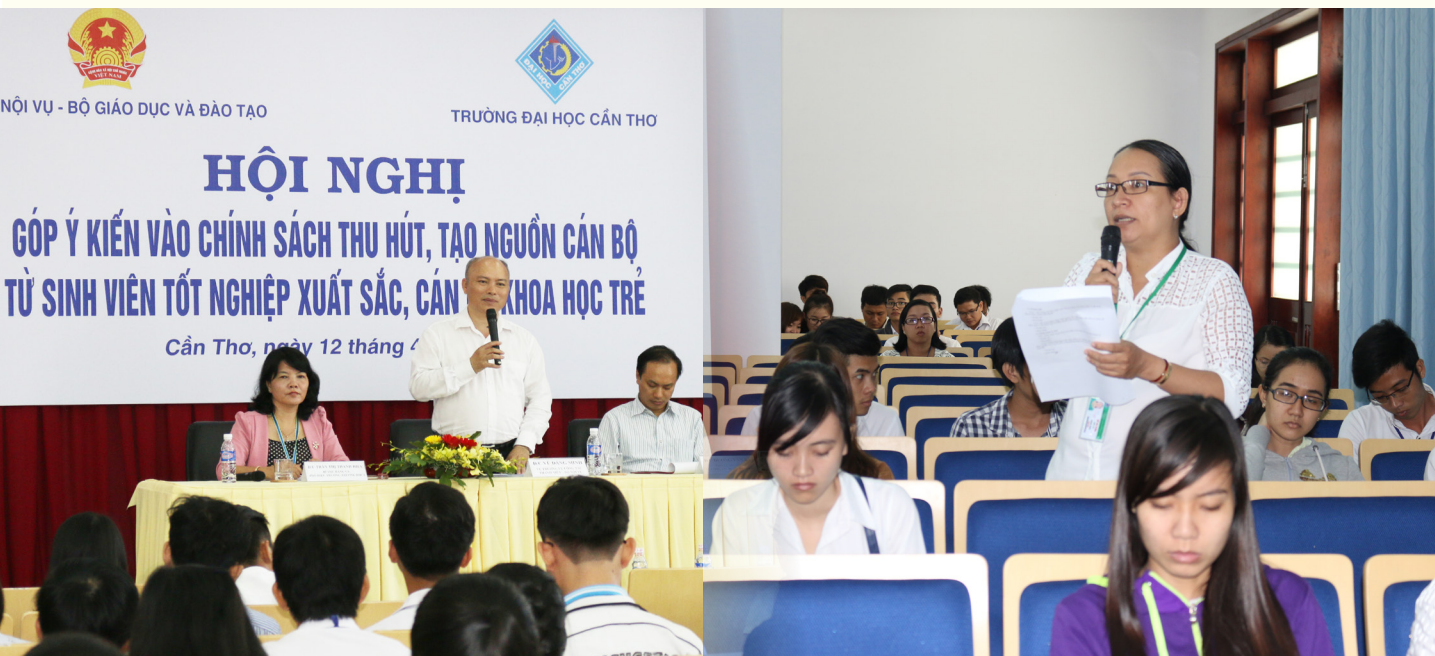
Tiếp nhận ý kiến đóng góp từ đại biểu

lượng lao động của tất cả các đơn vị cơ quan Nhà nước. Tại Hội nghị, các đại biểu tham dự đã được nghe giới thiệu dự thảo Nghị định về chính sách thu hút, tạo nguồn cán bộ từ sinh viên tốt nghiệp xuất sắc, cán bộ khoa học trẻ vào làm việc tại cơ quan, tổ chức của Đảng, Nhà nước, tổ chức chính trị-xã hội và lực lượng vũ trang. Trên cơ sở đó, Hội nghị đã tiếp thu những đóng góp của đại biểu tham dự về: tiêu chuẩn của đối tượng áp dụng chính sách thu hút, tạo nguồn cán bộ; các chính sách đối với sinh viên tốt nghiệp xuất sắc, cán bộ khoa học trẻ sau khi được tuyển dụng; và cách thức tổ chức thực hiện chính sách, góp phần hoàn thiện Nghị định và đưa vào thực tiễn.