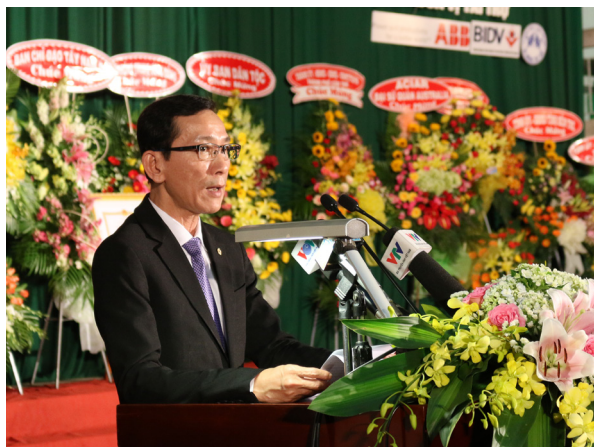
Ông Võ Thành Thống, Phó Bí thư Thành ủy, Chủ tịch UBND thành phố Cần Thơ phát biểu chúc mừng.

chân thành đến sự ủng hộ, giúp đỡ, chỉ đạo sát sao, kịp thời và có hiệu quả của Đảng và Nhà nước, Bộ GD&ĐT, của lãnh đạo thành phố Cần Thơ và các tỉnh trong vùng ĐBSCL, các cơ quan từ Trung ương đến địa phương; sự giúp đỡ tận tình của các tổ chức và cá nhân, sự đồng hành của các “Mạnh Thường Quân” góp phần to lớn