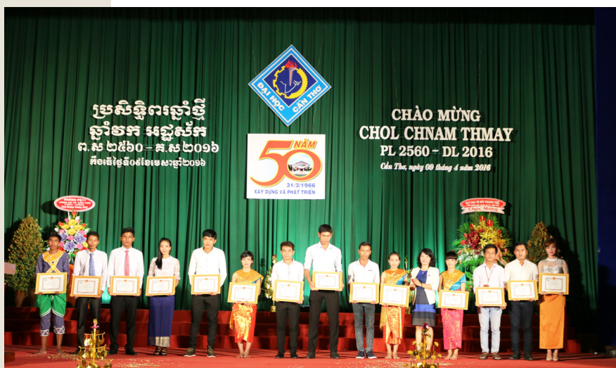
Khen thưởng cho sinh viên có thành tích trong học tập và các phong trào Đoàn-Hội.

Hàng năm, Đảng ủy, Ban Giám hiệu cùng các đơn vị luôn tạo điều kiện cho sinh viên dân tộc tổ chức buổi giao lưu sinh hoạt văn hóa-nghệ thuật mừng Tết cổ truyền Chol Chnam Thmay, Lễ Sen-Dolta, qua đó tạo điều kiện cho sinh viên các dân tộc khác hiểu hơn về bản sắc văn hóa dân tộc Khmer, thắt chặt hơn nữa tình đoàn kết giữa sinh viên và các dân tộc trong Trường.