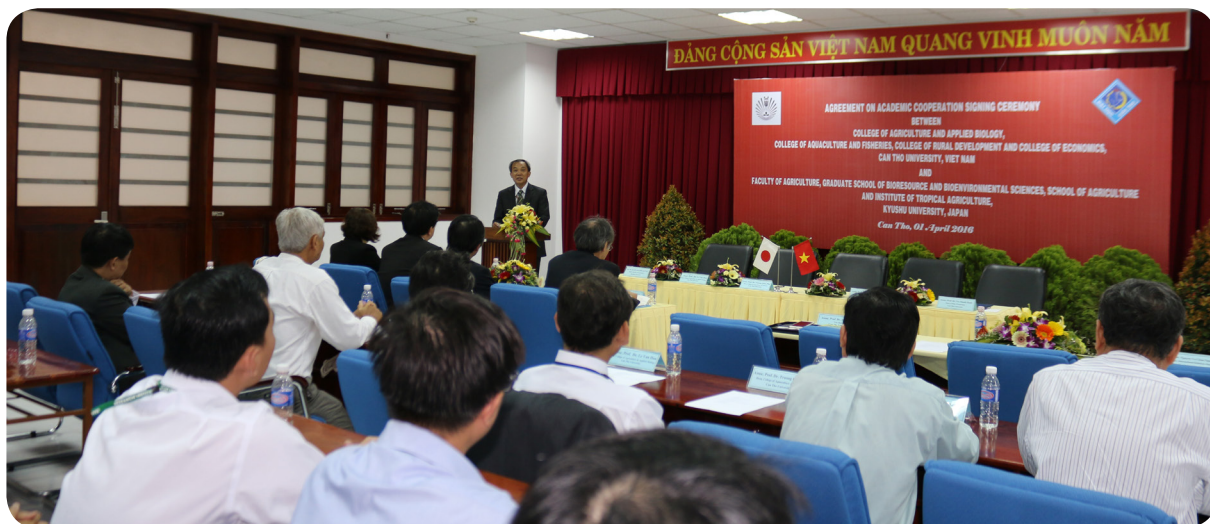
Lễ Ký kết hợp tác với Trường Đại học Kyushu, Nhật Bản.

Ngày 01/4/2016, tại Trường Đại học Cần Thơ (ĐHCT) đã diễn ra Lễ Ký kết hợp tác giữa các khoa: Nông nghiệp và Sinh học Ứng dụng, Thủy sản, Kinh tế, Phát triển Nông thôn của Trường ĐHCT và Khoa Nông nghiệp, Viện Nông nghiệp Nhiệt đới của Trường Đại học Kyushu, Nhật Bản.