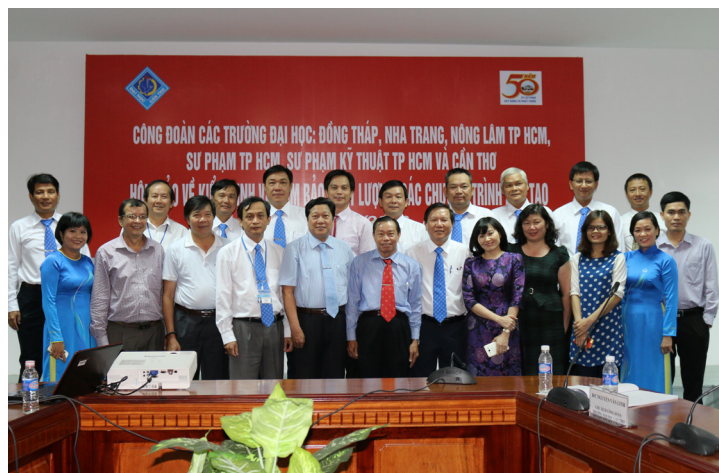
Đại biểu chụp ảnh lưu niệm.

Nằm trong chuỗi hoạt động giao lưu, trao đổi kinh nghiệm công tác với công đoàn các trường đại học liên kết trong 15 năm qua nhằm chào mừng 50 năm ngày thành lập của Trường ĐHCT (31/3/1966-31/3/2016), ngày 26/3/2016, Công đoàn Trường ĐHCT tổ chức Hội thảo kiểm định và đảm bảo chất lượng chương trình đào tạo nhằm chia sẻ những kinh nghiệm giúp cho Công đoàn làm tốt chức năng tham gia quản lý Nhà trường, giáo dục và động viên đoàn viên làm tốt nhiệm vụ chuyên môn, không ngừng nâng cao chất lượng đào tạo để Nhà trường có thể cạnh tranh và phát triển trong bối cảnh hội nhập quốc tế.