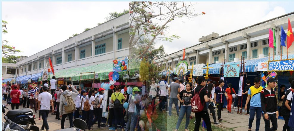
Hội trại Văn hóa Thanh niên.

Hoạt động 3: Thực hiện chương trình thanh niên