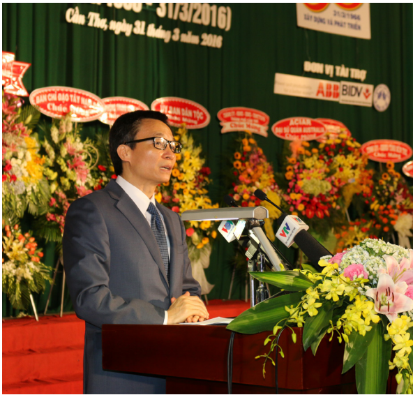
Ông Vũ Đức Đam, Ủy viên Ban Chấp hành Trung ương Đảng, Phó Thủ tướng Chính phủ phát biểu tại buổi lễ.

Trường đã phát triển 38 chuyên ngành đào tạo thạc sĩ và 15 chuyên ngành đào tạo tiến sĩ với quy mô gần 4.000 học viên cao học và nghiên cứu sinh.