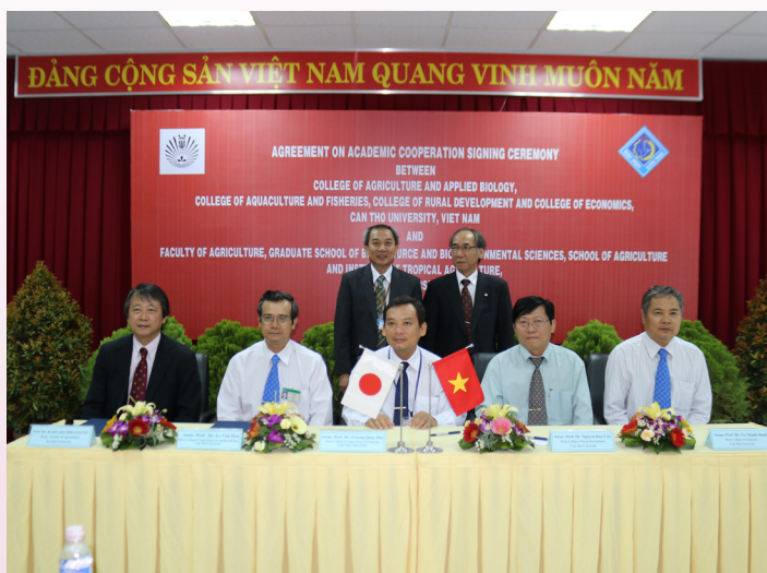
Lãnh đạo các đơn vị tham gia ký kết Bản ghi nhớ hợp tác dưới sự chứng kiến của lãnh đạo hai trường.

lần đầu tiên vào năm 1993. Trải qua hơn 20 năm, lần ký kết này được xem là cột mốc quan trọng đánh dấu sự hợp tác ngày càng mạnh mẽ giữa hai trường.